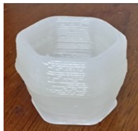
Modèle 3 (Goblet de forme hexagonale)