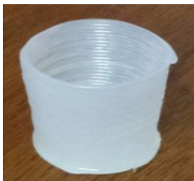
Modèle 2 (Goblet de forme circulaire)